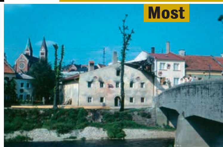
V srpnu 1959 zanechalo výrazné stopy natáčení chudobince.