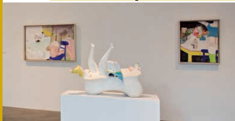
Heimrad Prem, V koupelně , 1967; Lothar Fischer, Koupající se dívka , 1967; Heimrad Prem, Zátiší , 1967; Foto: Andreas Pauly