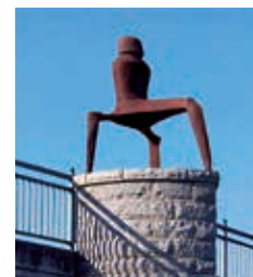
Od roku 1995 se na dnešním mostě před Muzeem SPUR nachází železná plastika Lothara Fischera „Velká sedící obrněná postava“.

Během 40. výročí Bavorské severní župy Hornofalckého kulturního svazu v Chamu otevírací doba prodloužena: 25.-29.06.2014 vždy 14-17 hod. vstup volný