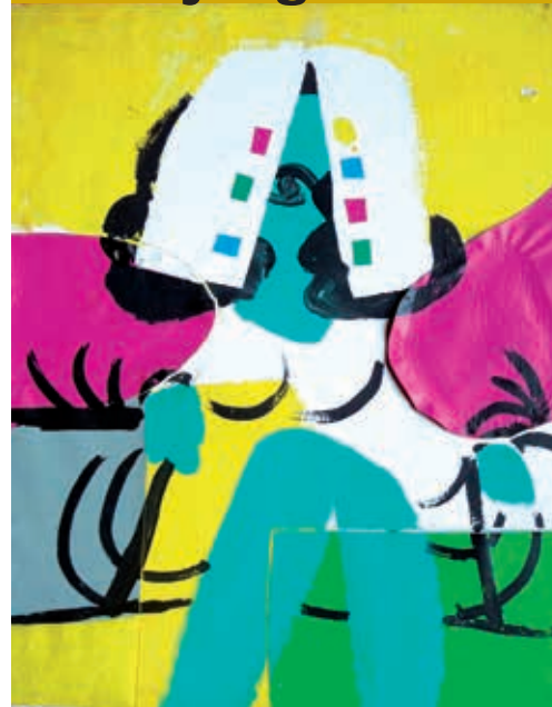
Heimrad Prem, bez názvu, 1977, olej, vinyl, koláž, plátno, 50 x 40 cm, ze soukromé sbírky Mnichov

Uměleckou síň Kunsthalle Pertolzhofen je možné navštívit přes den i v noci, dokud dodává solární zařízení elektrický proud.