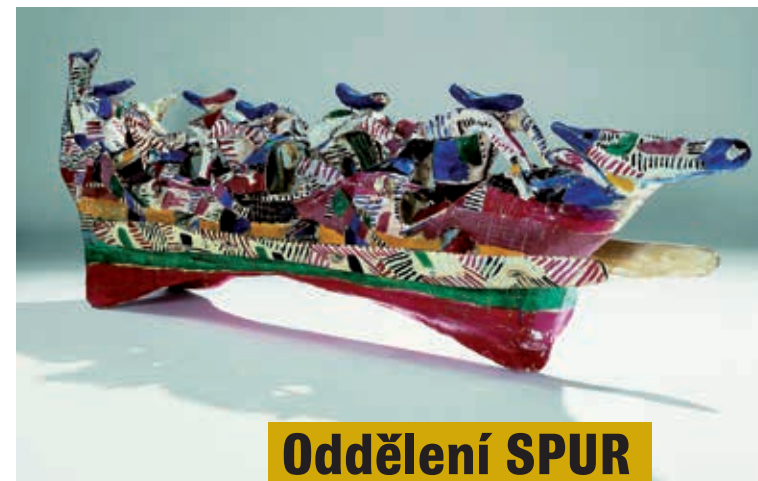
Lothar Fischer a Heimrad Prem, Pirátská loď (Lod' SPUR) , 1964; malovaná keramika, 65 x 210 x 40 cm, Umělecká síň Kiel, trvalá výpůjčka nadační skupiny Stifterkreis Kunsthalle zu Kiel

Umělecká síň Kunsthalle Pertolzhofen Am Bahnhof 1 | 92545 Pertolzhofen Akce kulturního spolku Kunstverein Pertolzhofen e.V. c/o Heiko Herrmann +49 (0) 9675 15 52 oder +49 (0) 162 312 29 01 www.kunstverein-pertolzhofen.de info@kunstverein-pertolzhofen.de