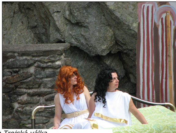
Jak začala a skončila Trojská válka