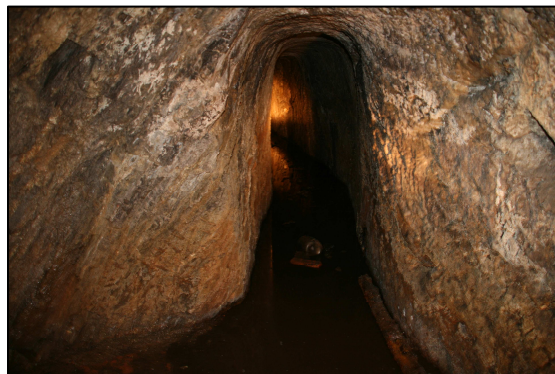
Štola I vpravo