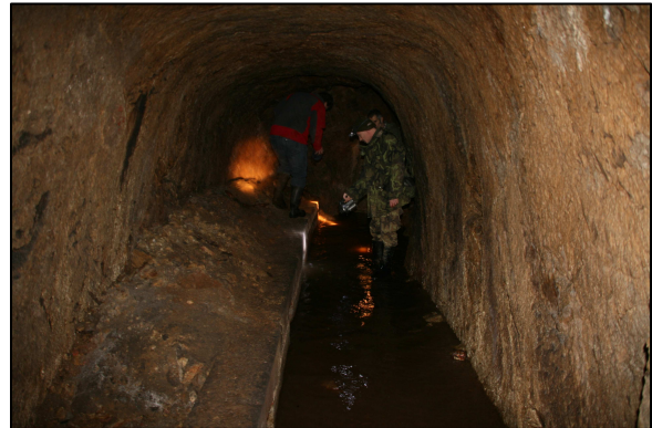
Chodba pivovar sklep

Vzhledem k tomu, že báňský řád z Kutné Hory měl platnost v Čechách, a dokonce i ve většině Evropy, můžeme objevenou štola považovat za dědičnou, rozměry překvapivě přesně odpovídají.