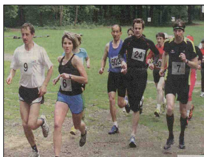
Prvomájový přespolní běh