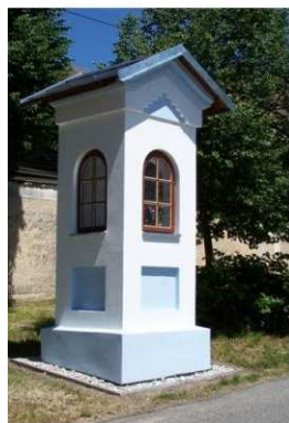
Opravená kaplička v Bystřici

Od července 2010 do května 2011 realizovala MAS Ekoregion Úhlava projekt mezinárodní spolupráce "Zlepšení vzhledu obcí v Ekoregionu Úhlava" s bavorskou MAS Landkreis Cham. Spolupráce byla zaměřena především na rozvoj společných aktivit v obnově kulturního dědictví regionu, které tvoří především sakrální památky. Jedním z výstupů projektu proto byla i stavební obnova čtyř sakrálních staveb - kapliček v centrální části Ekoregionu Úhlava (Blata, Stará Lhota, Bystřice nad Úhlavou, Hodousice).