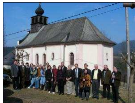
Exkurze v Hamrech

Druhá část projektu je věnována vytvoření společných informačních materiálů, které interpretují kulturní dědictví obou regionů. Materiály vznikly na základě výměny zkušeností, které proběhly v rámci dvou exkurzí - v říjnu 2010 na Klenové a v březnu 2011 v Hamrech. Projekt je finančně podpořen z Programu rozvoje venkova ČR na období 2007 – 2013 osy IV.Leader.