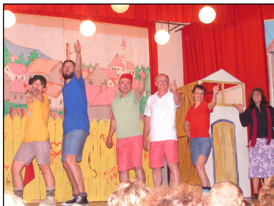
Z divadelní hry Rychlé šípy

Zájemci o ochotnické divadlo se začali v Dešenicích pravidelně scházet před pěti lety. O pouti v roce 2006 odehráli společně s dětmi z mateřské školy představení o Sněhurce a sedmi trpasličích. Toto představení sice mělo řadu začátečnických chyb, ale nevzalo nám chuť pokračovat.