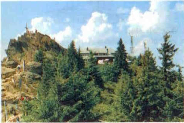
Grenzverlauf am Ossergipfel