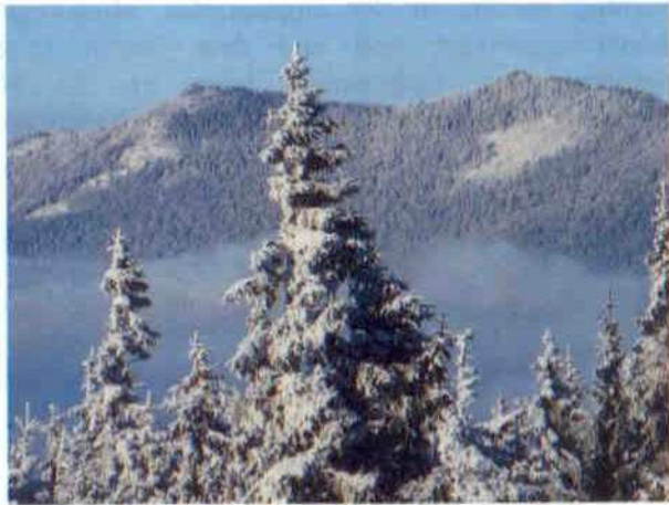
Blick auf die beiden Ossergipfel